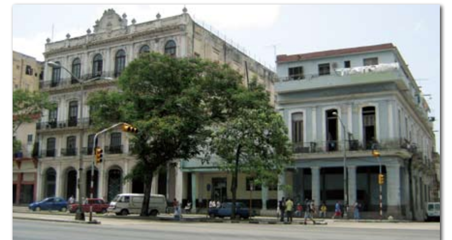
Der Gebäudeteil rechts im Bild könnte, vergleicht man dieses Gebäude mit dem auf dem historischen Foto, ein Teil der Manufaktur gewesen sein.

Trotzdem lohnte sich natürlich ein Blick auf die Avenida Salvador Allende. Dabei stellte sich heraus, dass auf der Avenida Salvador Allende No.617, an der Ecke Calle Oquendo, ein Gebäudeteil steht, das, betrachtet man die historischen Fotos, ein Rest der altherwürdigen Manufaktur „La Madama“ sein könnte. Nur vier Säulen, also etwa ein Viertel des alten Gebäudes, stehen noch. Die Fenster in der oberen Etage haben die richtige Form, ebenso die eckigen Säulen, und auch das Muster des Balkons ist identisch mit dem auf dem historischen Foto. Leider findet sich am Gebäude keinerlei Hin-