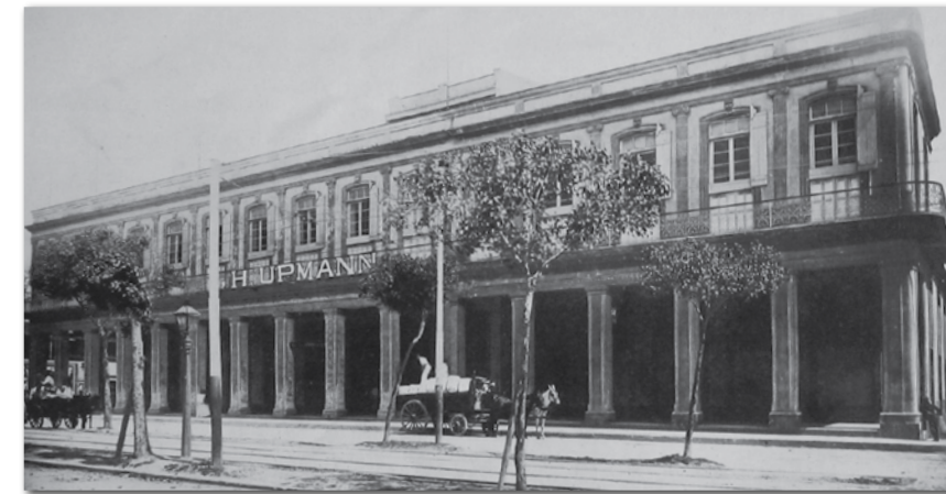
Die damals berühmte, weil für ihre Zeit sehr große Manufaktur „La Madama“, hier auf einer historischen Fotografie.