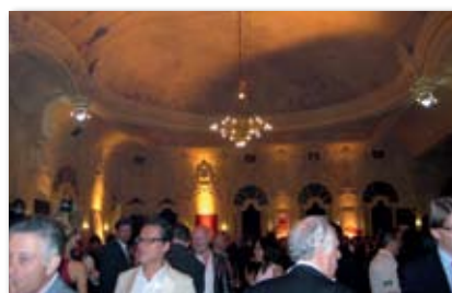
Noche de Bienvenida im Salon de Carpentier

Diese Cigarre mit 55er Ringmaß und einer Länge von 130mm ist dem Format nach eine Montecristo, ein vollkommen neues Format im Habano-Sortiment. Habanos s.a. möchte mit der Wide Churchills nach eigenen Angaben die Lücke zwischen der erst vor einigen Jahren eingeführten Short Churchill und der klassischen