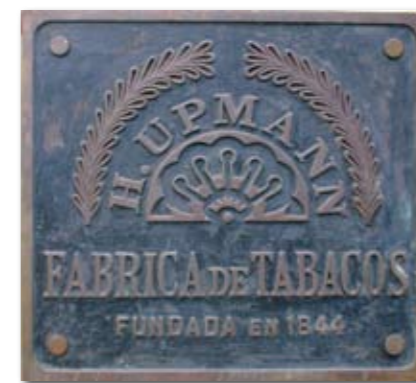
Das Firmenschild, das die heute noch tätige Upmann-Fabrik ziert, ist offensichtlich über all die Jahre hinweg von Fabrik zu Fabrik mitgewandert.

Interessanterweise siedelten sich die Brüder Hupmann, wie die Familie wohl ursprünglich hieß, 1844 nicht in der Altstadt Havannas an, sondern auf der Calle San Miguel 85 im Stadtteil Centro Habana. Dieser Stadtteil liegt direkt neben der Altstadt, außerhalb der damals noch existierenden Stadtmauer. Heute gelangt man in die Calle San Miguel, wenn man vom Prado aus und vor dem Capitol stehend, in die Straße zwischen Gran Teatro und Capitol hineinläuft, bis man zur Calle Industria gelangt. In dieser biegt man rechts ein. Würde man an dieser Stelle nach links laufen, käme man direkt zur Real Fabrica de Partagás. Rechts entlanglaufend, überquert man zunächst die Calle San Rafael und gelangt daraufhin unmittelbar zur nächsten Straße, der Calle San Miguel. Biegt man nun gleich rechts in die Calle San Miguel