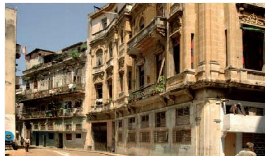
Nicht nur die Gebrüder Upmann siedelten ihre Manufaktur in dieser Straße an, auch Partagás und Por Larrañaga waren hier zu finden.

wohl schon mehr Kontakt gehabt. Befand sich schließlich dessen Manufaktur von 1834 bis zum Ende des 19. Jahrhunderts auf eben dieser Straße und, wenn man den historischen Stadtplänen Glauben schenken darf, direkt gegenüber auf der anderen Straßenseite, nämlich auf dem Teil der Straße zwischen der Calle Consu-