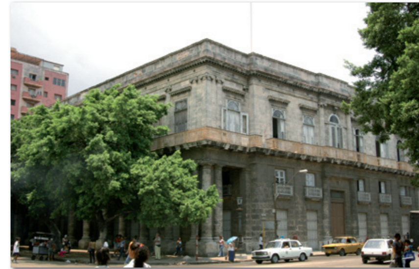
Die Vorderseite des Palacios ist mit Bäumen gesäumt. Vor reichlich hundert Jahren waren diese Bäume noch sehr klein, doch heute verdecken sie beinahe die gesamte Ansicht.

Der „Palacio Aldama“ beherbergte viele Jahre lang, vor allem zur Blütezeit der cubanischen Cigarrenindustrie gegen Ende des 19. Jahrhunderts, die berühmte Manufaktur „La Corona“.