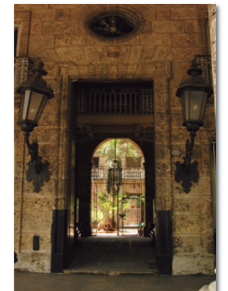
Durch eine breite Einfahrt gelangt man in den Innenhof des Palacios.

Anfang des 20. Jahrhundert bekam der zweistöckige „Palacio Aldama“ ein drittes Stockwerk aufgesetzt. Als Cigarrenmanufaktur wurde der Palacio bis 1932 genutzt, jedoch im Zuge eines Generalstreiks der Cigarrenroller geschlossen. Ein Jahr später öffnete das Haus zwar wieder seine Pforten, aber nicht als Manufaktur, sondern als Kaufhaus. Als Kaufhaus und Bürogebäude wird es auch heute noch genutzt. Die dritte Etage entfernte man im Jahr 1971. Seitdem präsentiert sich das Gebäude wieder in seiner ursprünglichen Form.